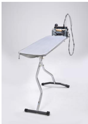
Bügelcenter KETTLER 2000

Mabipress Pro2 (L31 x B27,7 cm) ist 100% kompatibel zu allen Kettler und Mabi Bügeltischen. Die 160 cm lange Schlauchführung gewährleistet eine Nutzung mit den meisten handels-üblichen Bügeltischen.