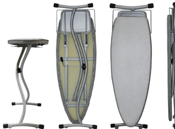
Abgebildete Bügeltische sind nicht im Preis enthalten