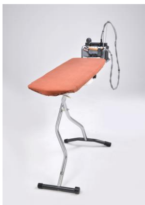
Bügelchamp KETTLER Professional